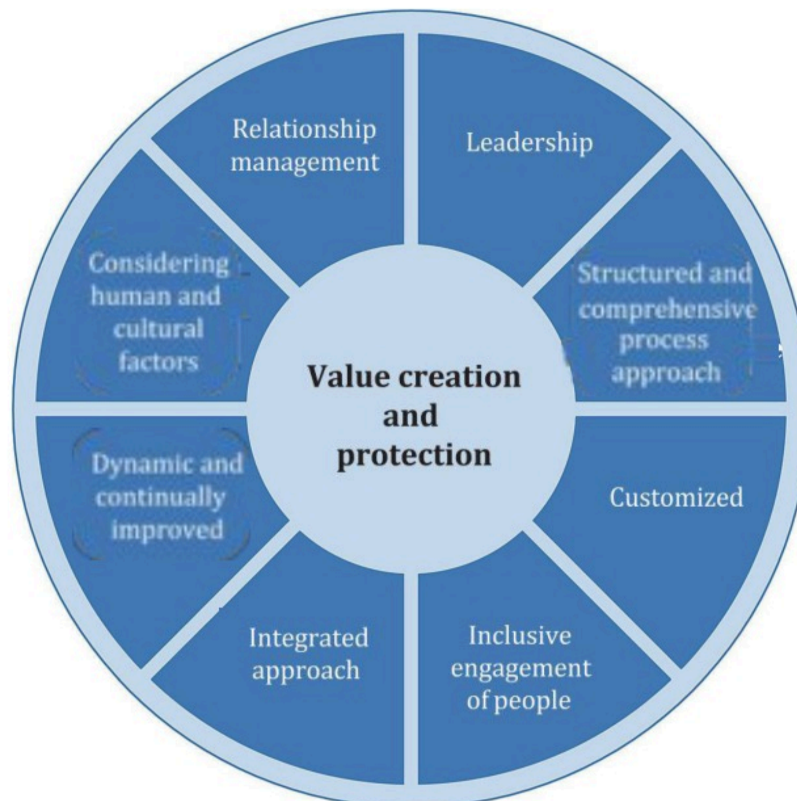
图2 - 原则